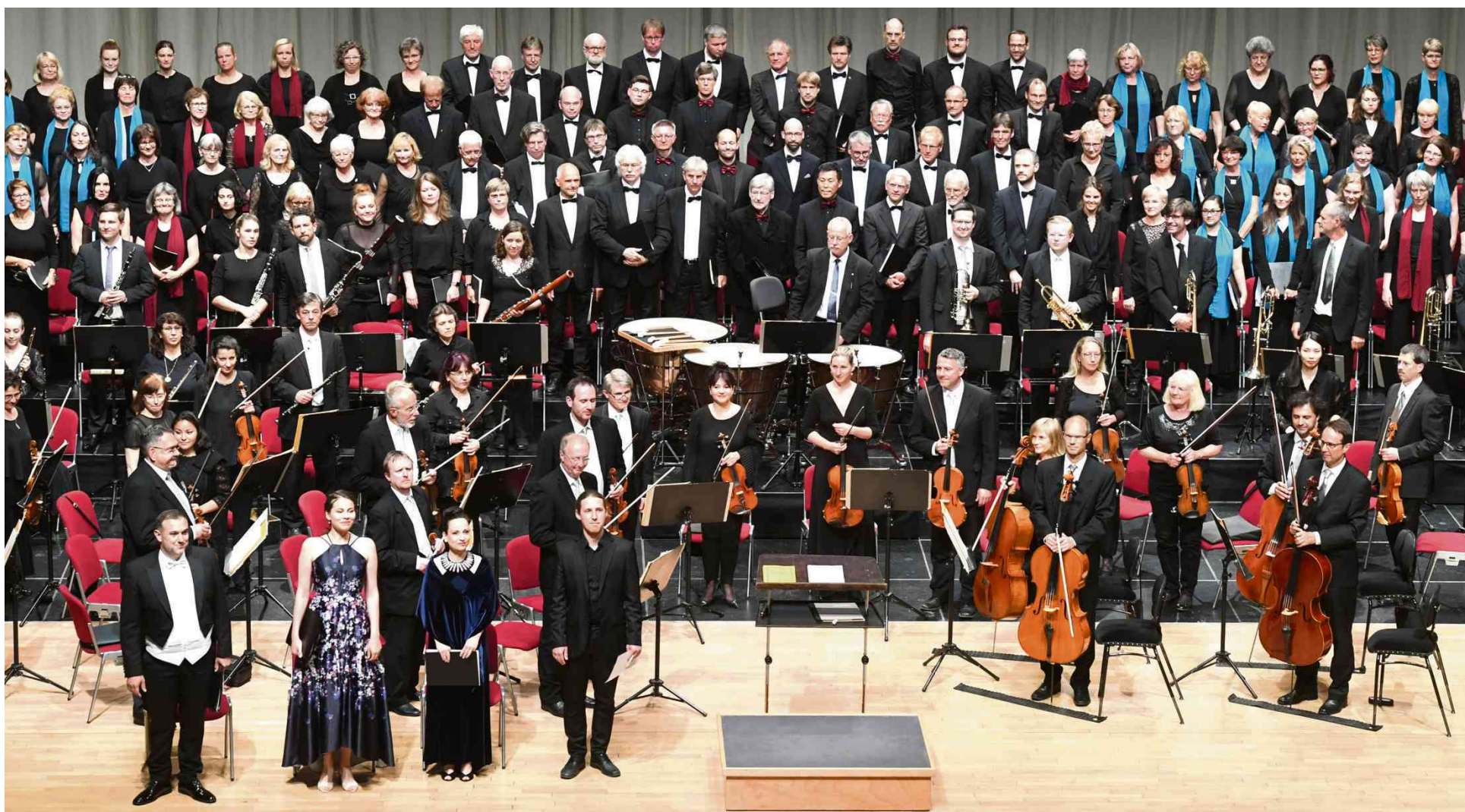
Die Suhler Singakademie und ihre Gäste begeisterten mit einer fantastischen Aufführung des „Lobgesangs für Suhl“ im Congress Centrum.

Mit 45 Sängerinnen und Sängern der Suhler Singakademie hatte Sommer kurz zuvor am 4. Juni an einem chorsinfonischen Konzert im Leipziger Gewandhaus teilgenommen. Dort traten insgesamt 520 Mitwirkende zum 30-jährigen Bestehen des Leipzi-